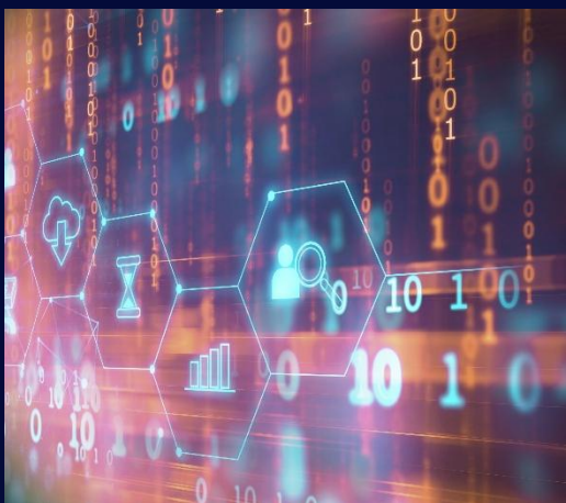
Съвместимост на данните