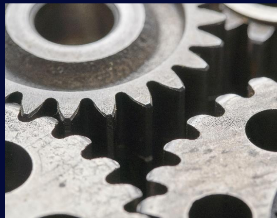
Реинженеринг на процесите