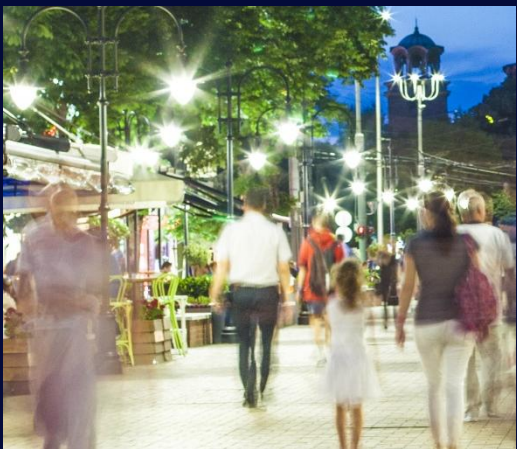
Решения, базирани на нуждите