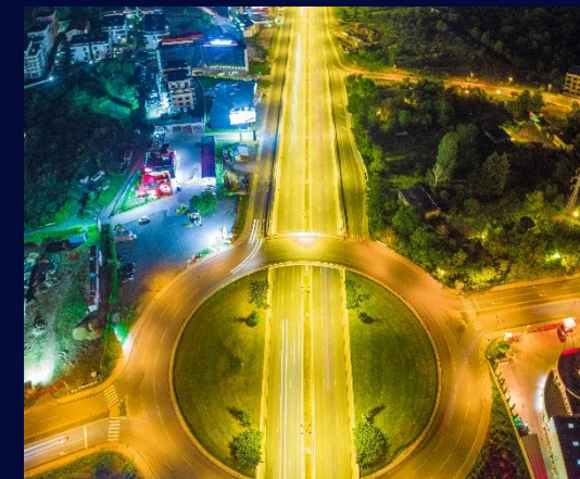
Синергия и включване на партньори