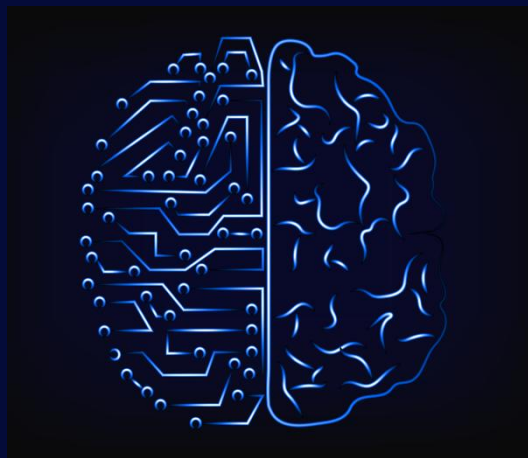
Гражданите и бизнеса „в центъра“